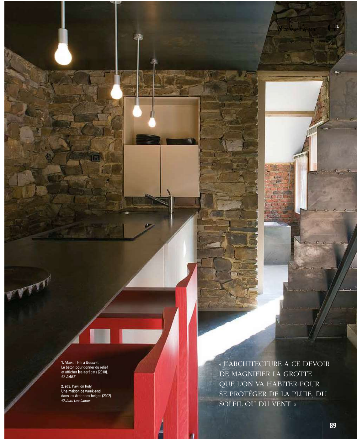
1. Maison Hifi à Bousval. Le béton pour donner du relief et afficher les agrégats (2010).