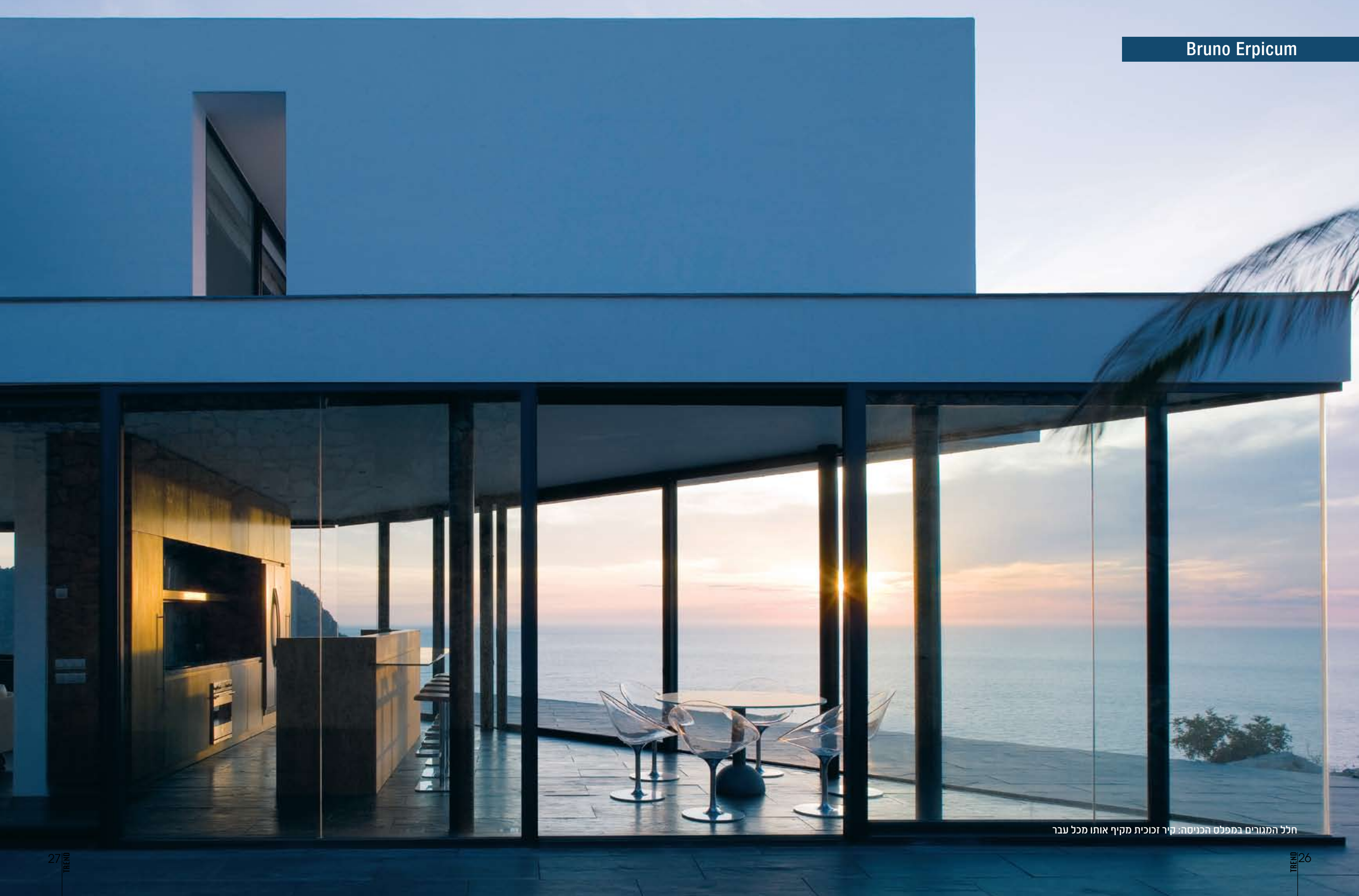
חלל המגורים במפלס הכניסה: קיר זכוכית מקיף אותו מכל עבר