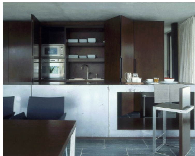
COCINA. Adosado a la pared, un mueble, también de madera de ocumen, que contiene varios electrodomésticos, la zona de aguas y la de almacenamiento.

debemos buscar la manera de responder con equilibrio a las tensiones del entorno y a las necesidades y deseos del cliente. Y éste quería, sobre todo, una casa de estilo contemporáneo con abundante luz natural”.