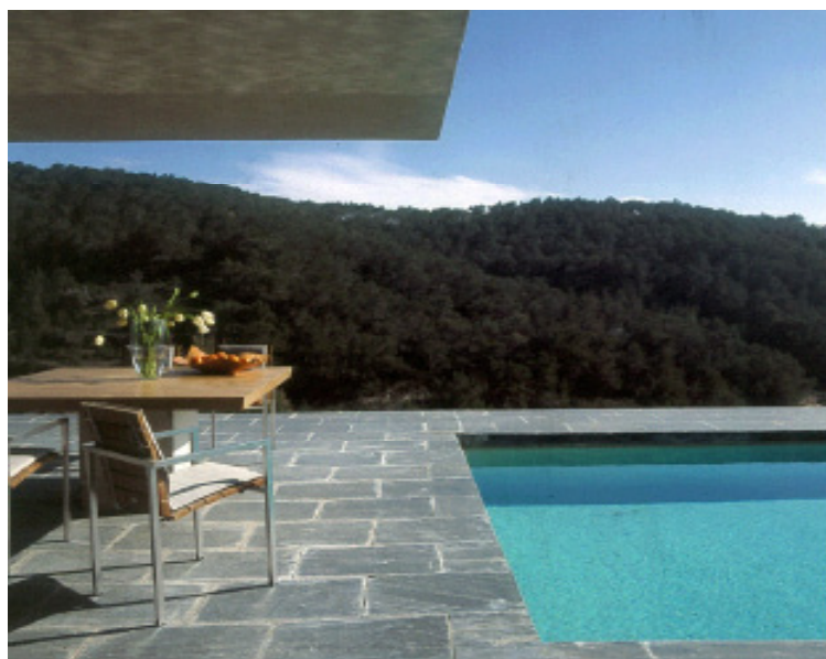
JUEGO DE MATERIALES. El suelo de losas de pizarra convive con la lámina de agua de la piscina, el hormigón pintado del alero y la madera del mobiliario.

Cerca del casco histórico de Ibiza se encuentra la población de Jesús, rodeada por colinas donde conviven la piedra, los pinos, los olivares, los almendros y la vegetación baja, acostumbrada al viento y al sol extremos. Como si surgieran de la montaña, dos volúmenes blancos y un tercer volumen de madera coronan una de esas colinas, tallada por las tradicionales terrazas destinadas originalmente al cultivo. Estos volúmenes brindaron todo el juego necesario para que el arquitecto belga Bruno Erpicum consiguiera dar vida a una casa de 400 m 2 de superficie, que se integra en el paisaje sin caer en la tentación de mimetizarse con él o de imitar la arquitectura mediterránea tradicional.