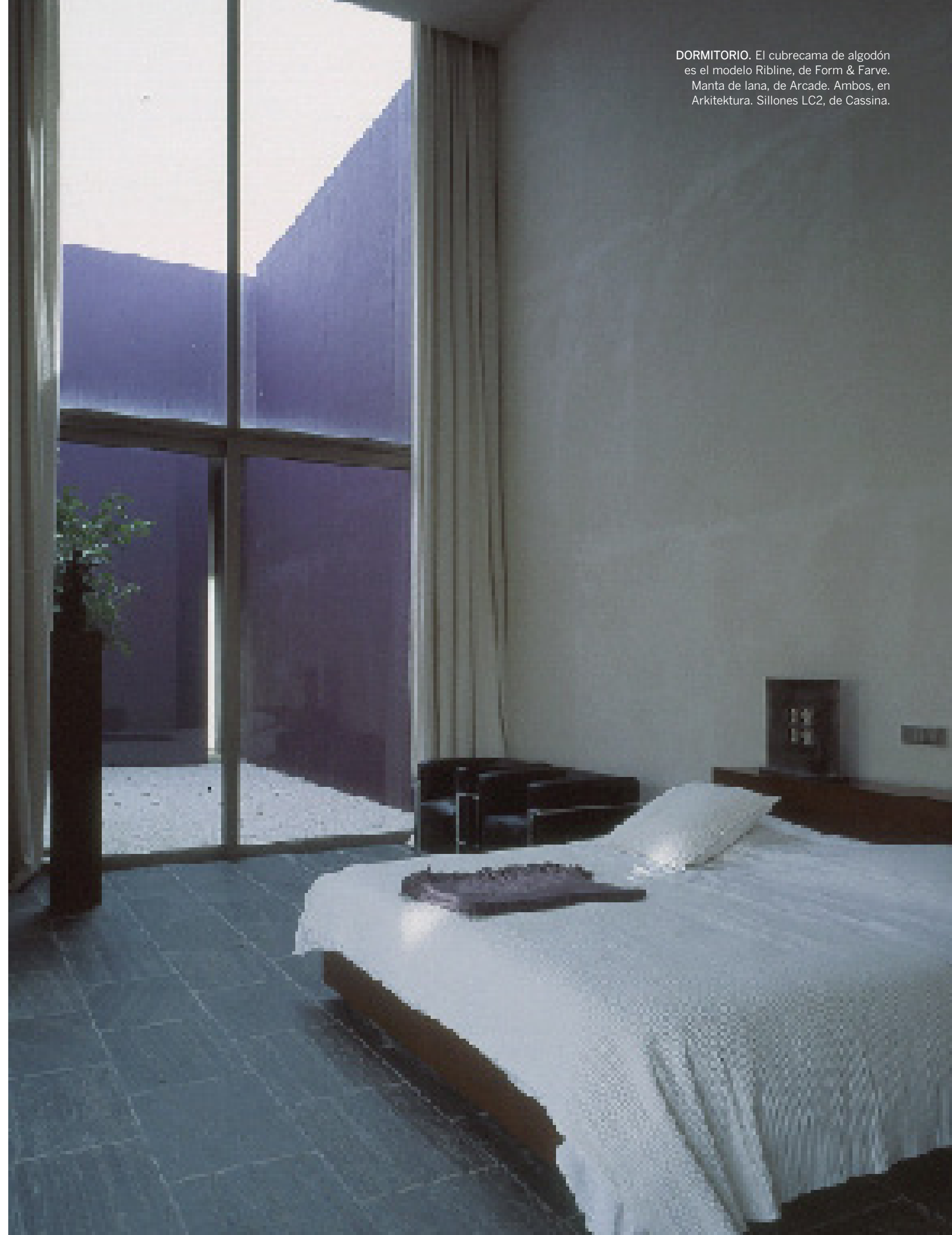
DORMITORIO. El cubrecama de algodón es el modelo Ribline, de Form & Farve. Manta de lana, de Arcade. Ambos, en Arkitektura. Sillones LC2, de Cassina.