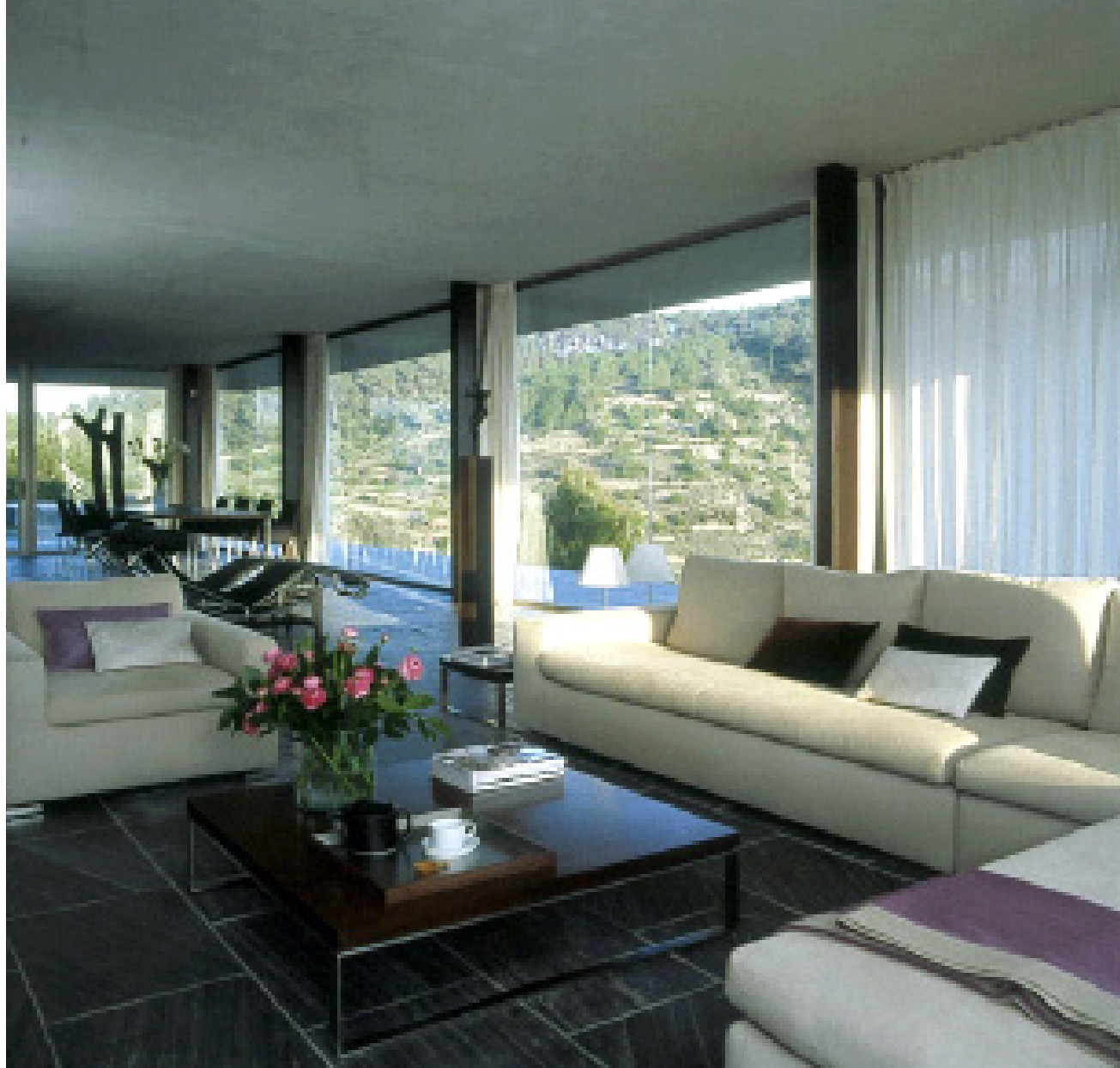
ESTAR HACIA COMEDOR. Sofás Gilbert, diseñados por Rodolfo Dordoni para Minotti. Sobre ellos, varios cojines y un plaid, de Maison de Vacances, en CoriumCasa. La mesa de centro, con estructura de acero y sobre de madera de ocumen, es un diseño del arquitecto.