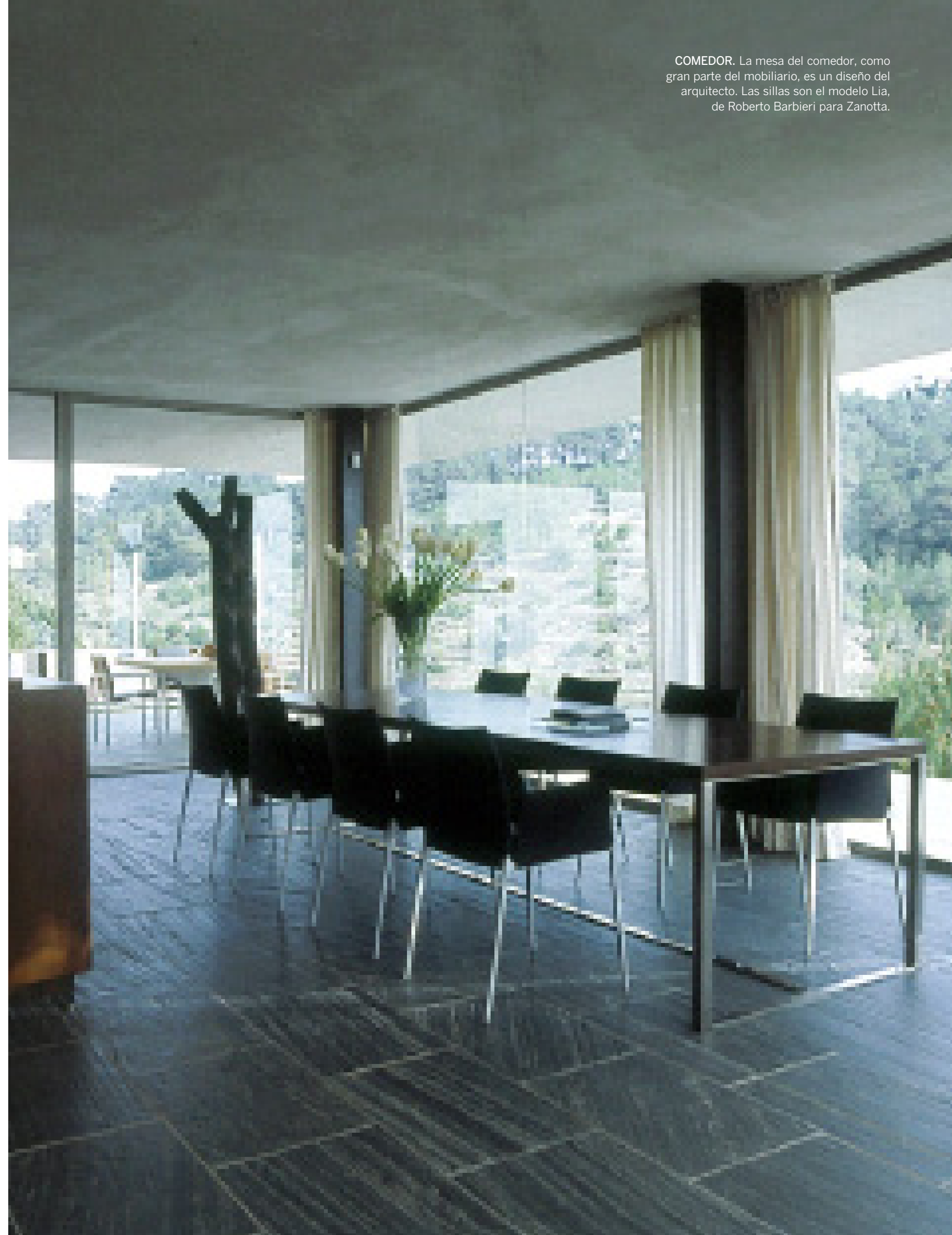
COMEDOR. La mesa del comedor, como gran parte del mobiliario, es un diseño del arquitecto. Las sillas son el modelo Lia, de Roberto Barbieri para Zanotta.

El volumen principal, columna vertebral del proyecto, es un gran prisma blanco formado por dos plantas. En la planta baja se encuentran el garaje, el baño y los dormitorios, mientras que en el nivel superior se ubican el estudio y la biblioteca. El segundo volumen, orientado hacia el sur, nace bajo el gran voladizo que cobija el amplio espacio acristalado, orientado asimismo hacia el sur, y que conforma la zona de día. A su alrededor, se extiende la terraza, en uno de cuyos extremos se encuentra la piscina, mientras que en el otro se ha emplazado un estanque cuya superficie refleja la luz solar en el techo de