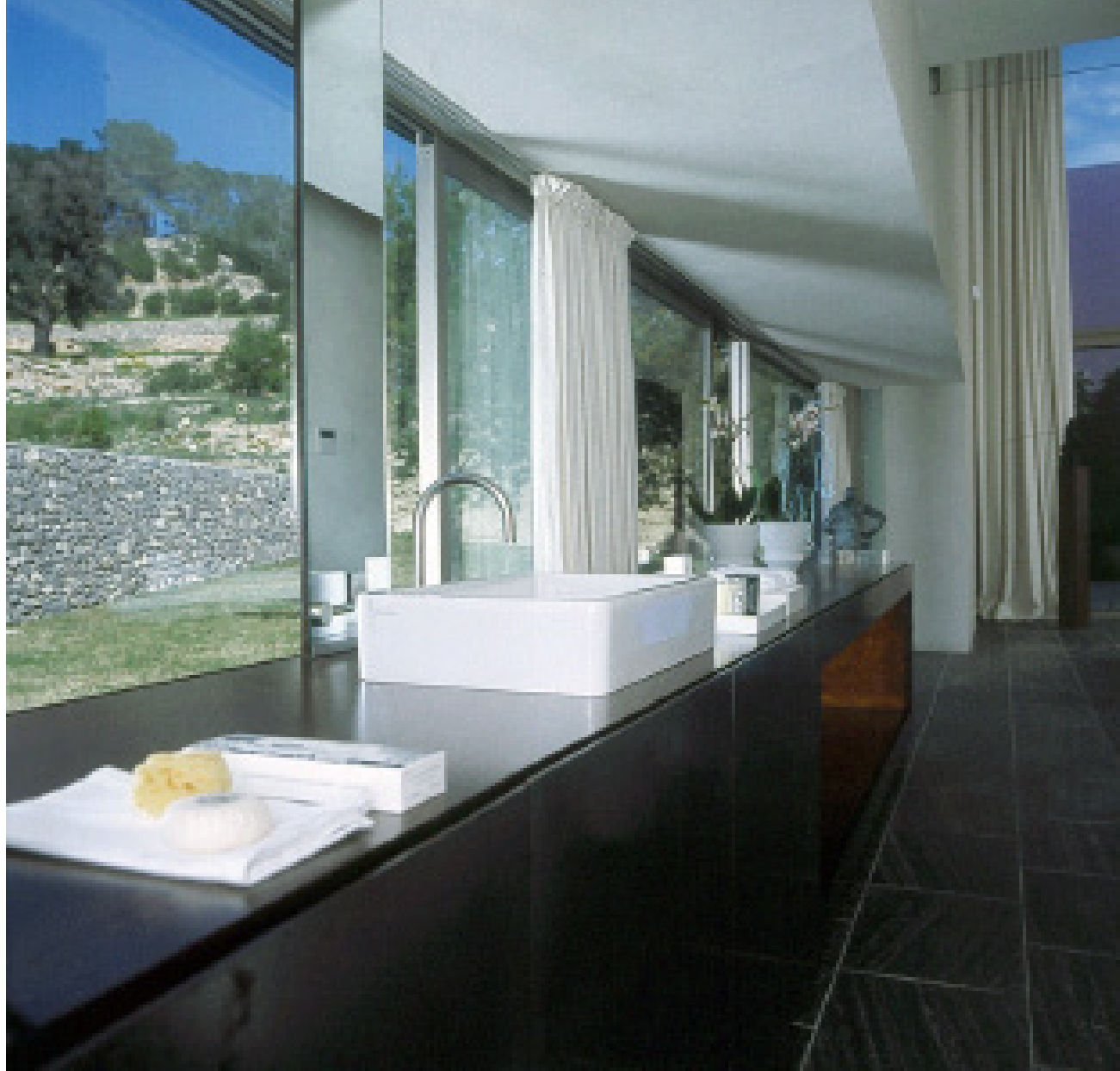
BAÑO. El mueble de esta zona ha sido realizado a medida y concebido como un aparador. Sobre él se apoyan dos lavamanos, modelo Vero, de Duravit. Grifería Tara Classic, diseño de Sieger Design para Dornbracht. Bandejas lacadas blancas, de Bianca, en Arkitektura.