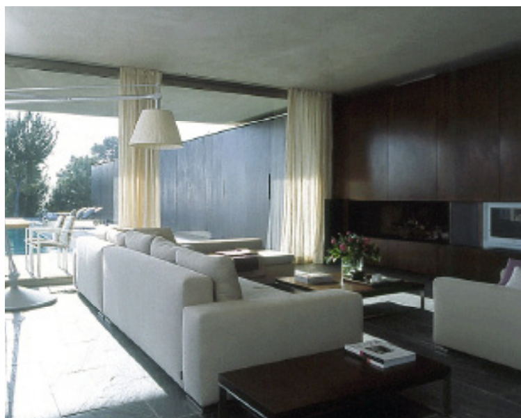
CHIMENEA. El volumen de madera del exterior penetra en el estar, donde se transforma en una pieza de mobiliario que alberga la chimenea y los armarios.