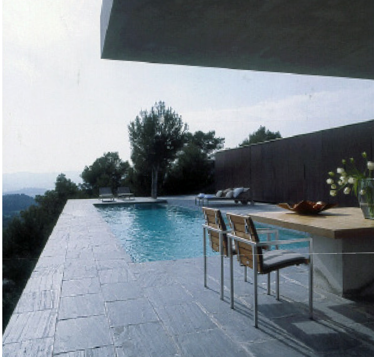
PERSPECTIVA. La vivienda se adapta al entorno, rematando una colina surcada por terrazas de uso agrario. Desde la plataforma de la piscina se observa el agreste paisaje de Ibiza. El volumen de madera de la derecha separa la zona de la piscina del acceso a la casa.