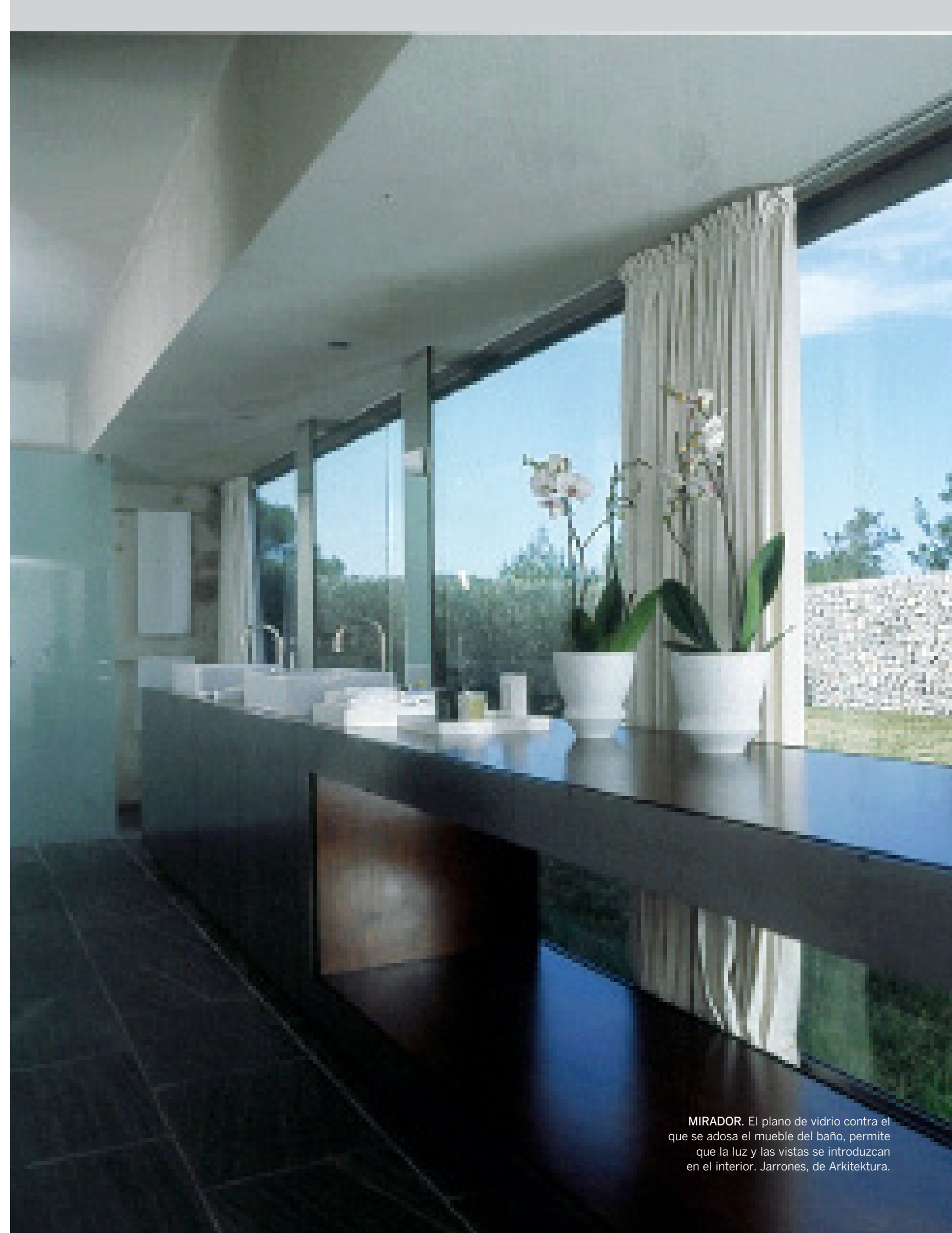
MIRADOR. El plano de vidrio contra el que se adosa el mueble del baño, permite que la luz y las vistas se introduzcan en el interior. Jarrones, de Arkitektura.