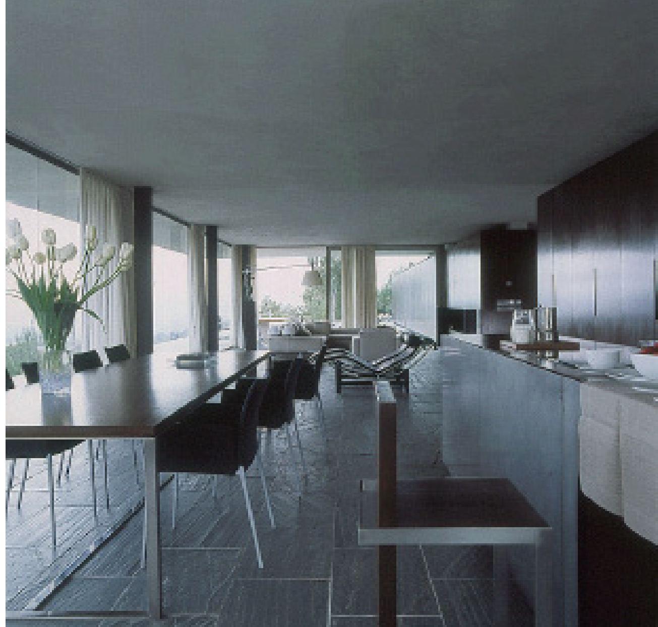
AMBIENTES ENCADENADOS. El estar, la zona de lectura, el comedor y la cocina se encadenan en un mismo espacio. La isla de la cocina se ha realizado con madera de ocumen y chapa de acero oxidado. En ella se han situado la zona de office y la vitrocerámica, de Smeg.