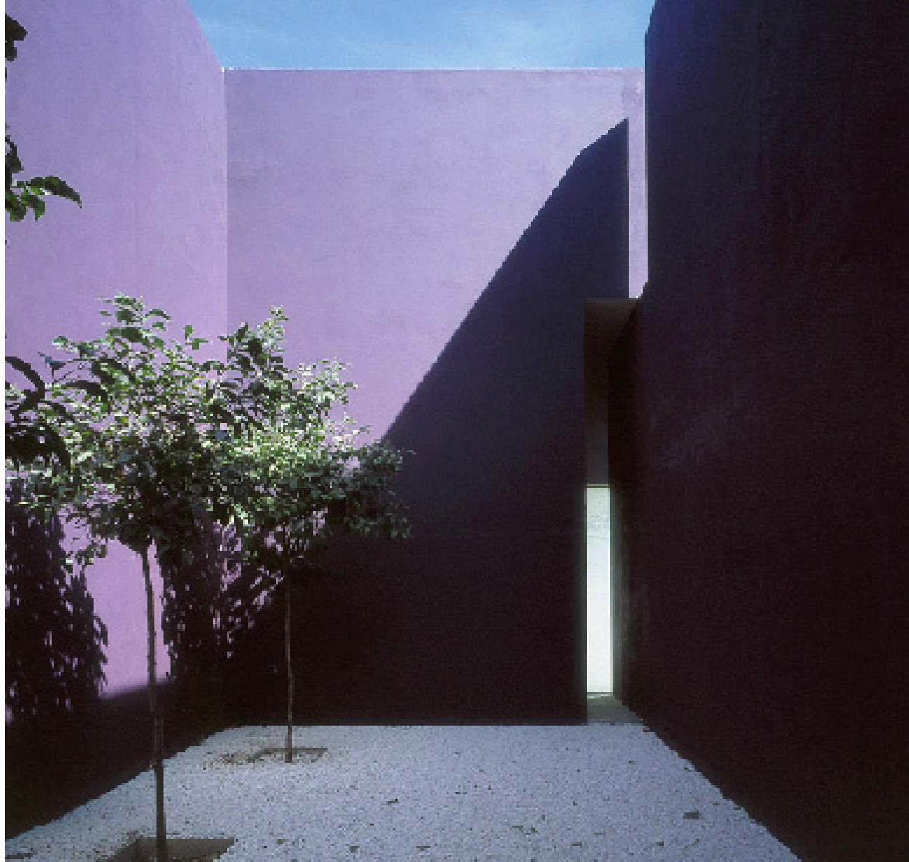
PATIO INTERIOR. Los muros de este patio se han pintado de color púrpura, “el color del pensamiento”, a petición del propietario. El suelo se ha cubierto con grava de mármol y en él se han plantado tres naranjos. El juego de luces y sombras crea efectos geométricos.