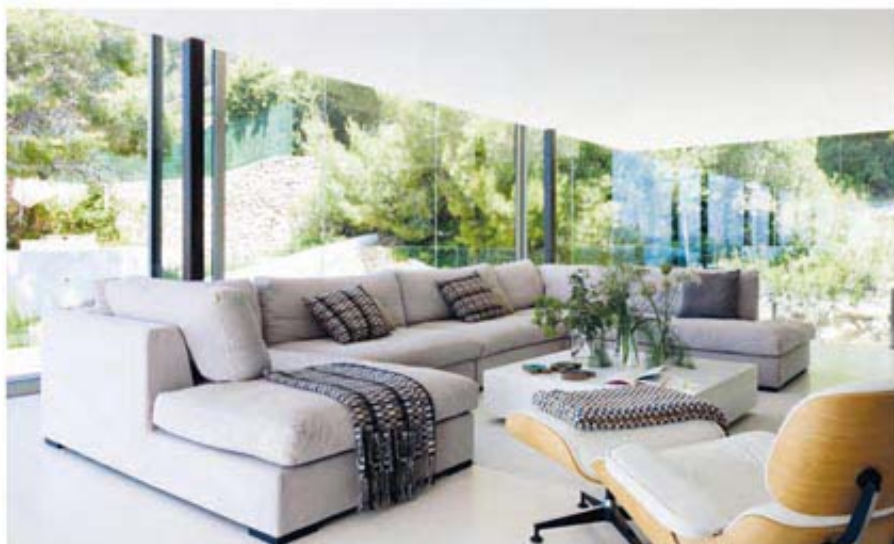
Estilismo Susana Ocaña. Textos Ada Marqués.

E l terreno que ocupa este singular proyecto de arquitectura, en la zona de Cap Martinet de la Isla de Ibiza, disfruta de la doble cercanía del puerto y de la ciudad y, por esa misma razón, goza de un acceso relativamente cómodo.