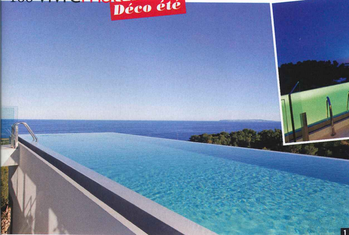
1. MIROIR, MON BEAU MIROIR La piscine à bords perdus est un miroir qui reflète le ciel et se prolonge sur la mer Méditerranée. Y

nager est une expérience unique. Ici, jamais le bassin ne semble se finir. Au bain de minuit, on est à l'avant-garde de la réalité et mer