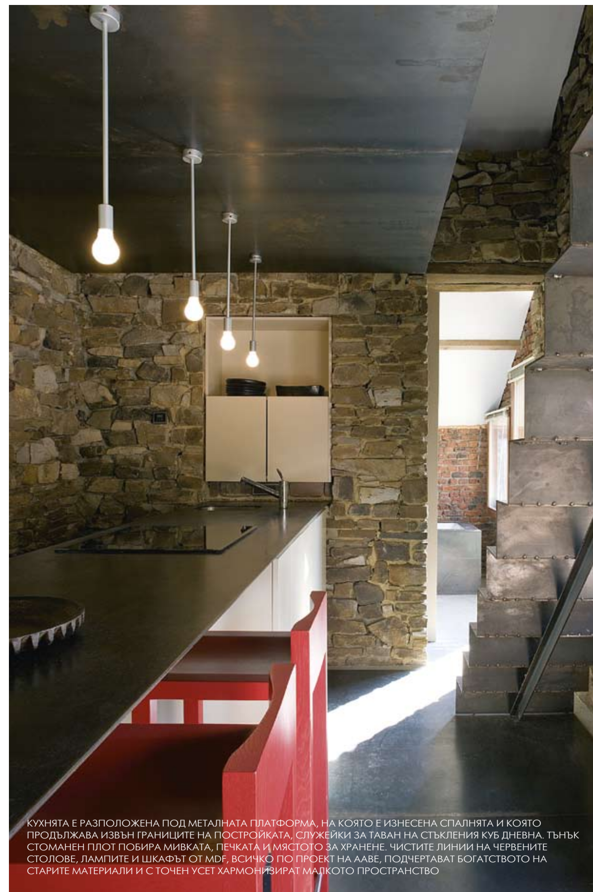
КУХНЯТА Е РАЗПОЛОЖЕНА ПОД МЕТАЛНАТА ПЛАТФОРМА, НА КОЯТО Е ИЗНЕСЕНА СПАЛНЯТА И КОЯТО ПРОДЪЛЖАВА ИЗВЪН ГРАНИЦИТЕ НА ПОСТРОЙКАТА, СЛУЖЕЙКИ ЗА ТАВАН НА СЪГЛЕНИЯ КУБ ДНЕВНА. ТЪНЪК СТОМАНЕН ПЛОТ ПОБИРА МИВКАТА, ПЕЧКАТА И МЯСТОТО ЗА ХРАНЕНЕ. ЧИСТИТЕ ЛИНИИ НА ЧЕРВЕНИТЕ СТОЛОВЕ, ЛАМПИТЕ И ШКАФЪТ ОТ MDF, ВСИЧКО ПО ПРОЕКТ НА ААВЕ, ПОДЧЕРТАВАТ БОГАТСТВОТО НА СТАРИТЕ МАТЕРИАЛИ И С ТОЧЕН УСЕТ ХАРМОНИЗИРАТ МАЛКОТО ПРОСТРАНСТВО